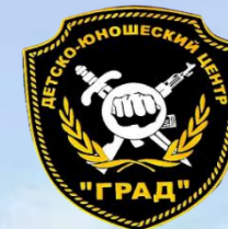
Учебный план 1 год обучения