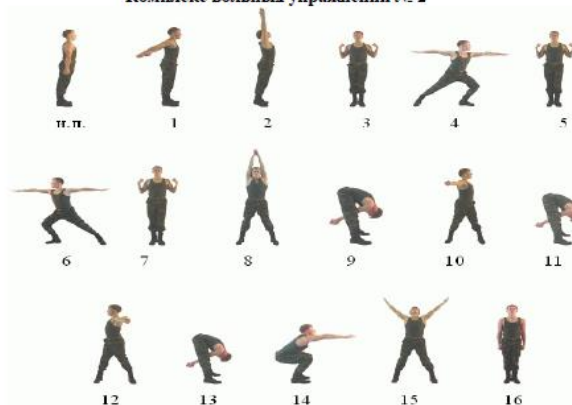
Комплекс вольных упражнений № 2

На «отлично» необходимо правильно выполнить упражнения на 16 счетов, на «хорошо» требуется выполнение 14 элементов, на «удовлетворительно»- 12 элементов.