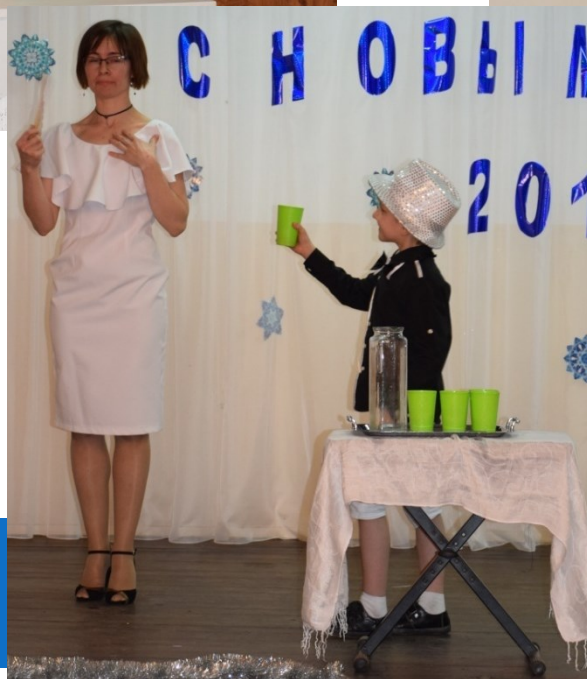
С. Джоплин «Артист эстрады» – ансамбль фортепиано, танец и фокусы