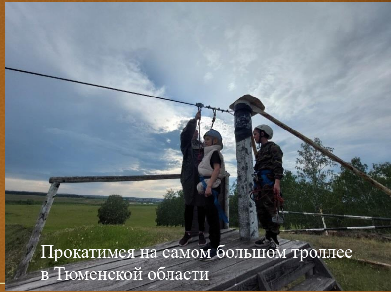
Прокатимся на самом большом троллее в Тюменской области