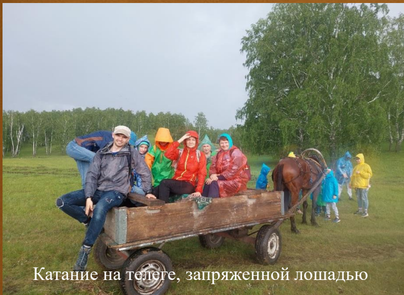
Катание на телеге, запряженной лошадью