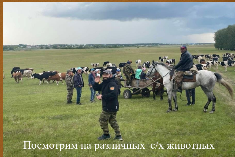
Посмотрим на различных с/х животных