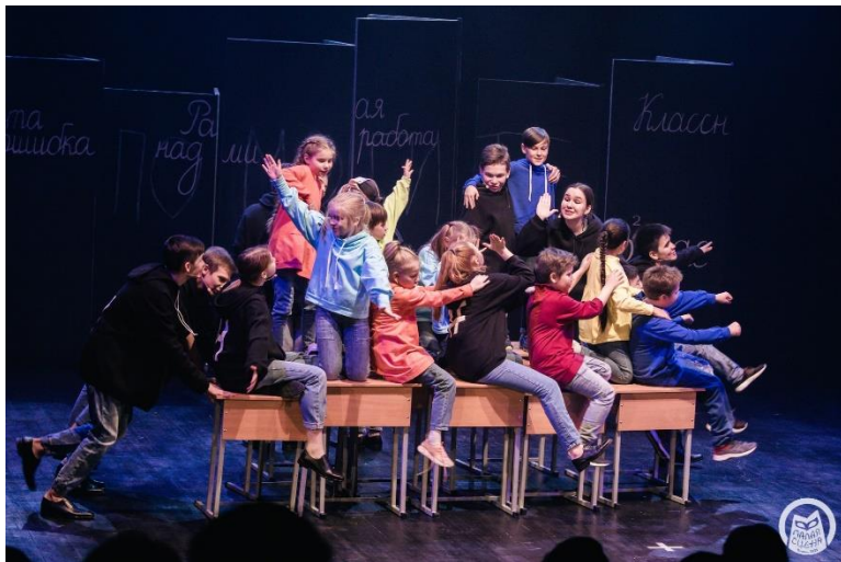
Мюзикл «Счастливым буду» (Реж. А.Васильев, Н.Соломатова)