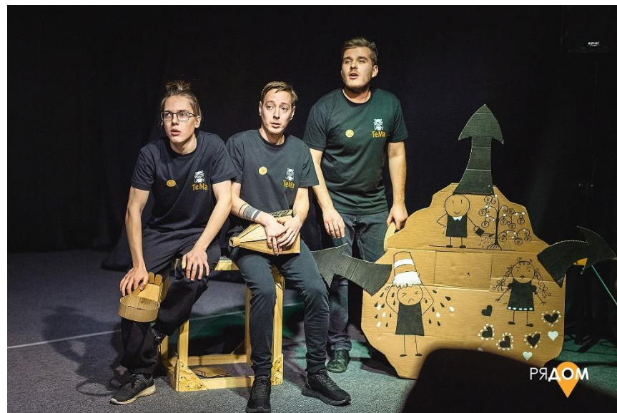
Семейный спектакль «Богатырь Степан Ромашкин» (реж. С. Ханжина)