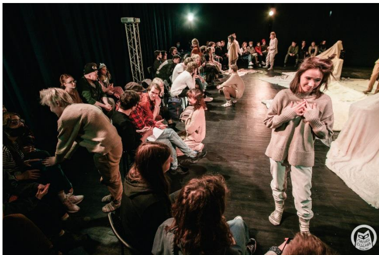
Перформанс «Пусть они всегда танцуют» (реж. И. Куркин) по книге У. Старка «Пусть танцуют белые медведи»