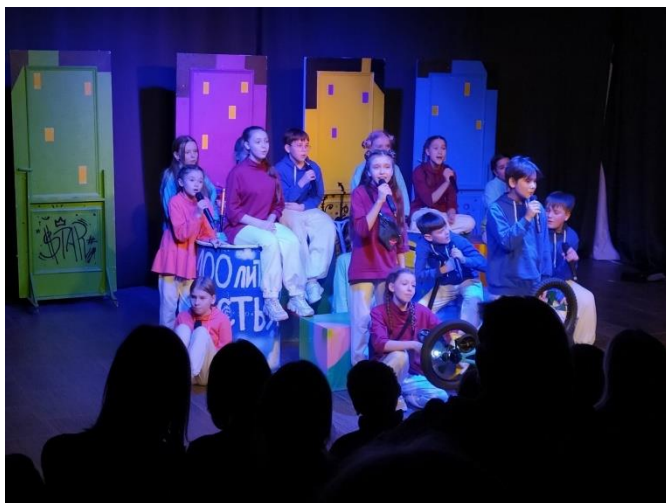
Театрализованная концертная программа