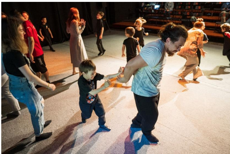
Открытые уроки с родителями