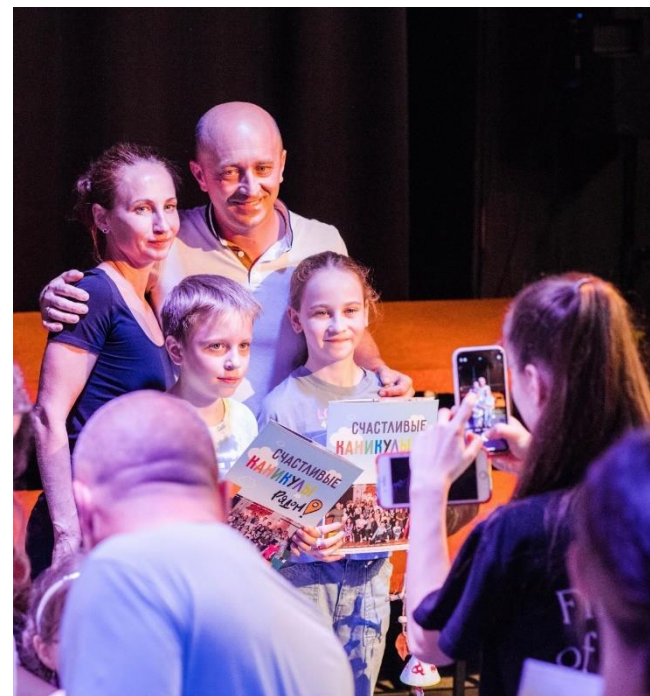
Летний интенсив «Семья РядОМ»