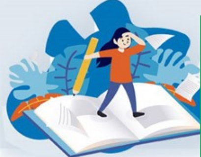
СХЕМА модульной дополнительной общеразвивающей программы