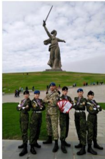
Караульная группа ВСМЦ "Россияне"